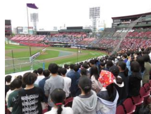
第 78 回定期戦 (R5. 5. 13)

令和 5 年度で戦後第 78 回目を迎える伝統ある行事です。開催数日前に両校の大勢の生徒が街中をアピール行進し、雰囲気盛り上げます。定期戦は 5 月中旬に楽天モバイルパーク宮城で開催され、両校の伝統ある全校応援合戦も見ものになっています。令和 5 年度も一高が優勝し、3 連覇を成し遂げました。