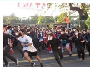
強歩大会スタート

秋の景色を満喫できる 10 月中旬に開催されます。全校生徒が早朝に学校を出発し、約 35km の道のりを各自のペースでゴールの秋保温泉をめざします。ゴール後の爽快感と豚汁や入浴は格別です。